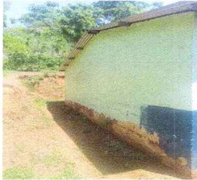
Foto1: SANJA EN MAL ESTADO